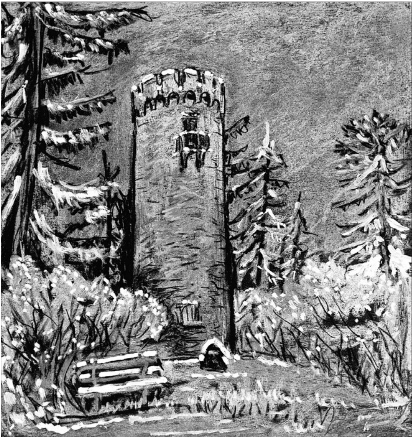
Pastellkreide, Eckard Weder, Kahla