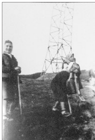
Zwangsarbeiterinnen (Sowjetunion) beim Anle- gen der Großgärtnerei am Walpersberg. Das Alter des Mädchens/Bildmitte ist eindeutig.

E-Mail: Zentrale@forst.thueringen.de (bitte im Betreff "Waldbiotopkartierung" angeben)