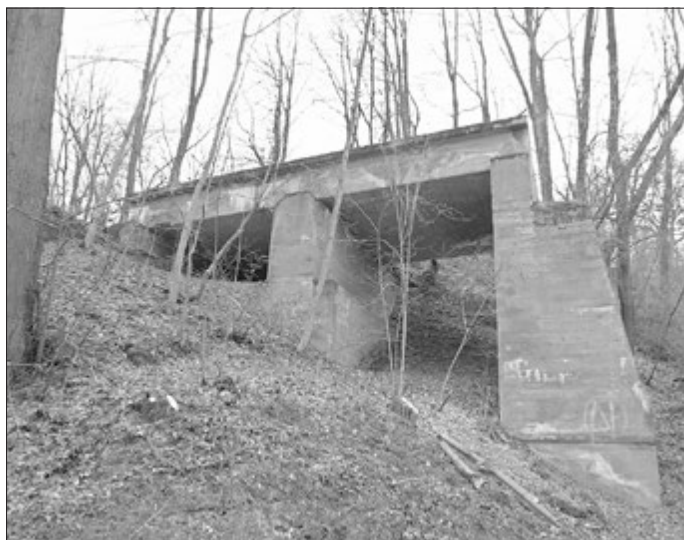
Eine der unvollendeten Reichsbahnanschlussbrücken (Ortsausgang Großbeutersdorf Richtung Eichenberg)