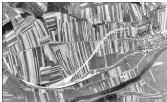
Der Verladebahnhof neben der Reichsbahnstrecke Berlin - München im August 1944

Bereits im April 1944 kamen über die Reichsbahnverbindung die ersten Lieferungen von Baumaterial, Maschinen und Flugzeugteilen am Walpersberg an. Der rasch wachsende Lieferumfang erforderte den Bau von zwei großen Verladebahnhöfen mit Lagerkapazitäten bei Großbeutersdorf. Auf einer Luftaufnahme der Royal Air Force vom 15. August 1944 ist bereits deutlich ein Verladebahnhof mit Umschlagplatz zu erkennen.