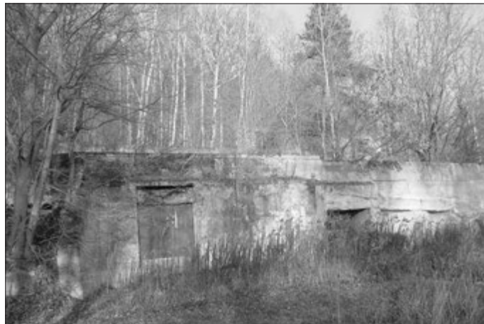
Das Gebäude für (Gewindehaus) für den Waggonaufzug – Gebäude für die Winden des Reichsbahnschrägaufzugs (Walpersberg, Südseite)