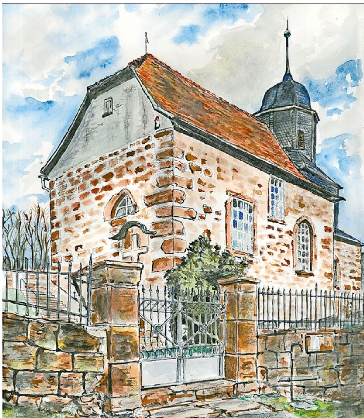
Bibra, Aquarell, 2020, Eckard Weder