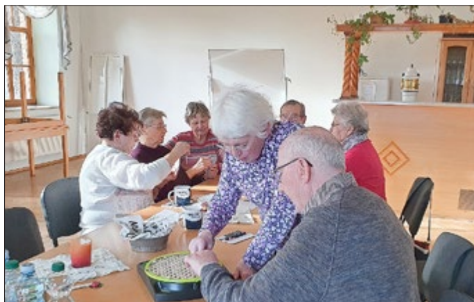
Seniorenspielnachmittag in Bucha

Wenn Sie Hilfe benötigen oder Fragen haben, rufen Sie Frau Wehrmeister unter 0160/94877063 an.