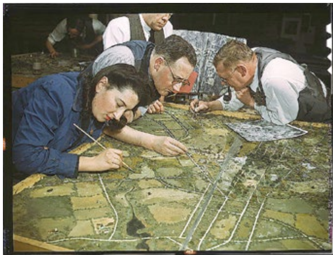
Anfertigung eines Modells anhand von Luftaufnahmen, Danesfield House