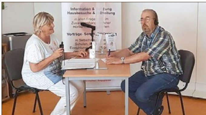
Beratungsgespräch DSB Ortsverein Weimar e. V.

Geben Sie diese Information gern weiter: an Familienangehörige, Freunde, Bekannte, ebenfalls Betroffene. Weiter Informationen dazu beim DSB Ortsverein Weimar e. V. unter der Telefonnummer: 03643. 42 21 55 oder per E-Mail: sozialerdienst@ov-weimar.de .