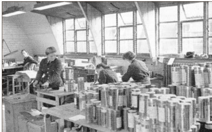
Film Dosen der Luftaufklärung zur Registrierung, Entwicklung und Auswertung