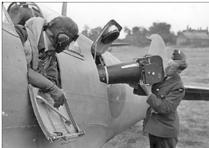
Entnahme einer Kamera aus einer britischen Spitfire

Ein Forschungsthema, das heute noch für Überraschungen sorgt, ist die Hinterlassenschaft der alliierten Luftaufklärung. Ein Foto zu betrachten ist das eine, es jedoch lesen und Interpretieren zu können erfordert fundiertes Fachwissen, Können und Erfahrung.