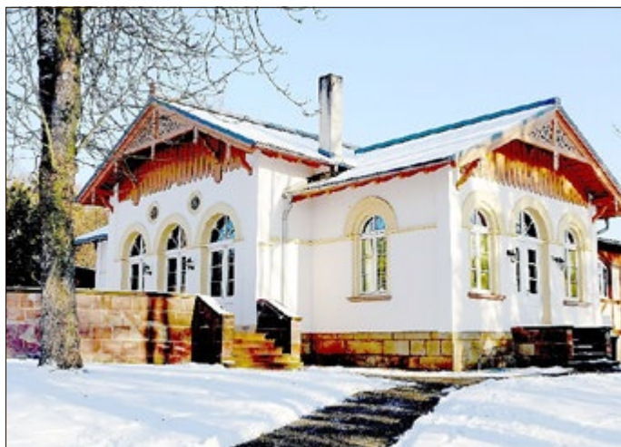
Teehaus Hummelshain im Winter