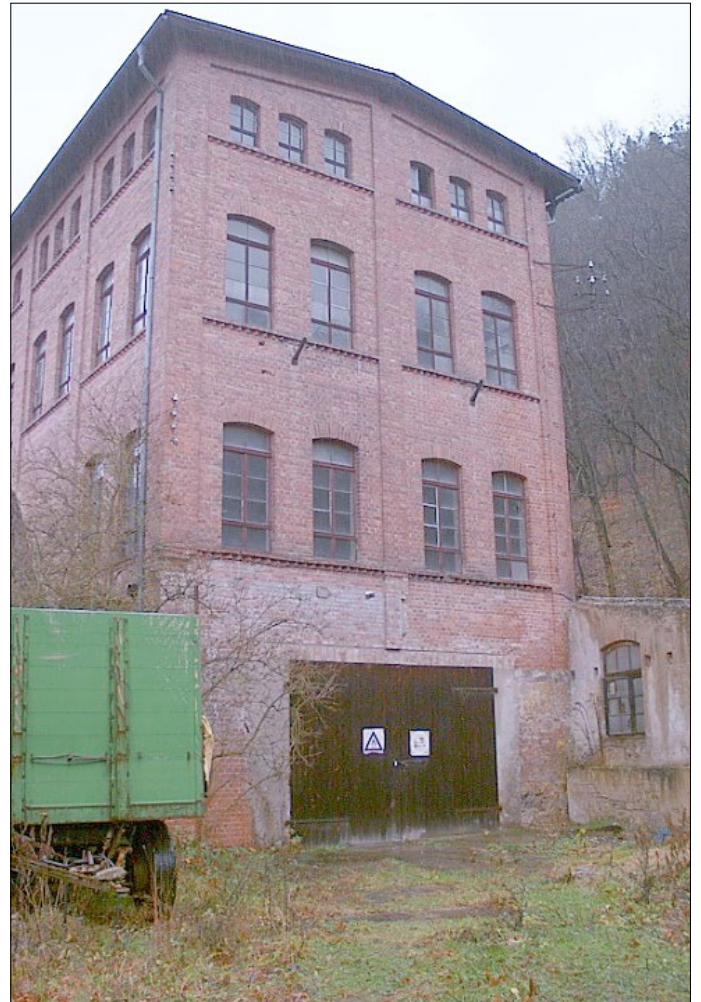
(das Porzellanwerk in Kleindembach heute)

Das Lager mit der wohl größten Entfernung zum Walpersberg war das in Kleindembach. Dessen Besonderheit war, dass es als einziges als slowakisches Kriegsgefangenenlager diente.