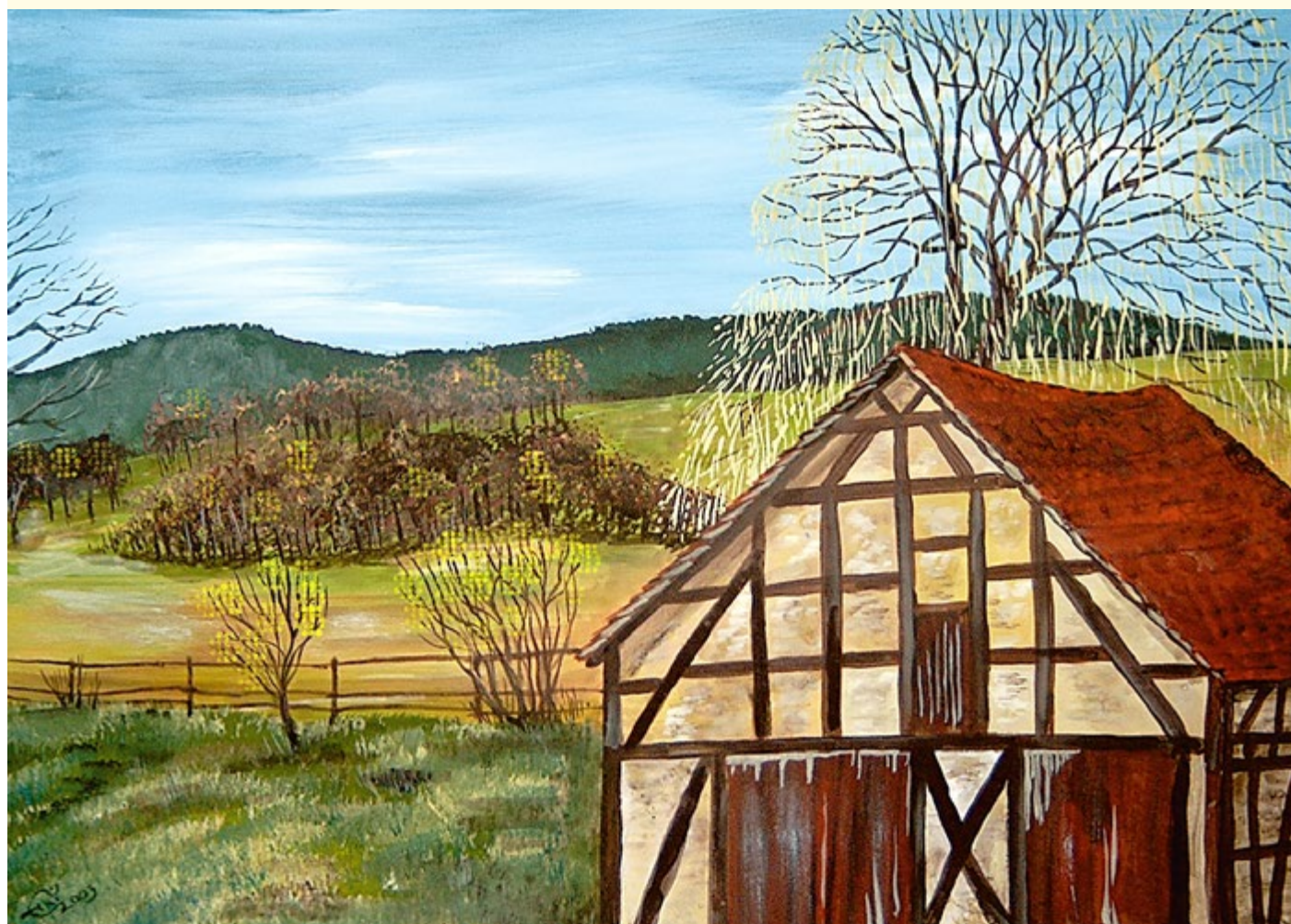
Frühlingserwachen, Acryl, 2009, Eckard Weder