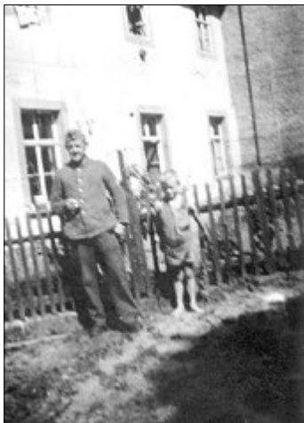
(deutscher Wachsoldat im Lager Kleindembach)