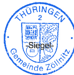
I. Helmke Bürgermeisterin

Öffentliche Bekanntmachung an den amtlichen Verkündungstafeln der Gemeinde Zöllnitz: