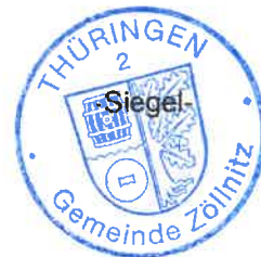
G. Sachse Bürgermeisterin

Die öffentliche Auslegung wird hiermit entsprechend § 3 Abs. 2 BauGB ortsüblich bekannt gemacht.